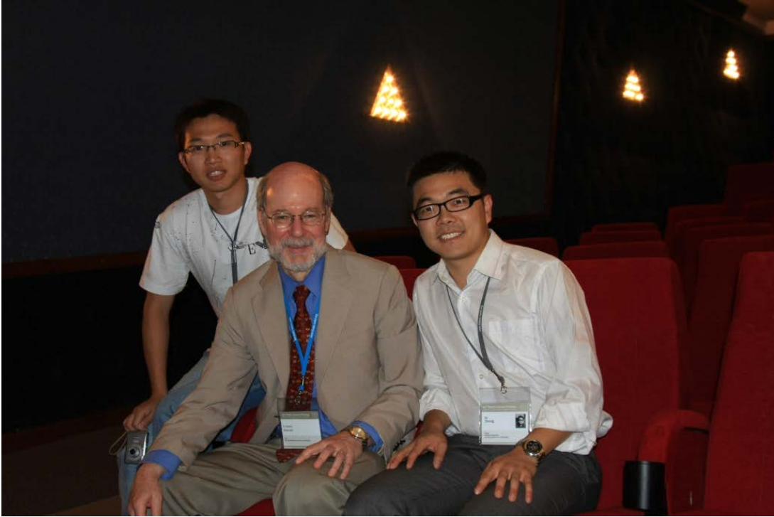
我（左）罗伯特·霍维茨-2002年诺贝尔生理医学奖（中间）钟波-第一届吴瑞奖(右)